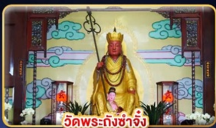
วัดพระถึงช้าง