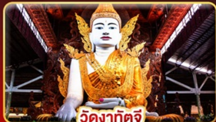
วัดดงกัจจ

สักการะ 3 มหาบุชาสถาน พักบนอินทร์แวน 1 คืน