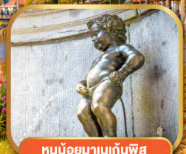
หนูน้อยมานเกินพิส