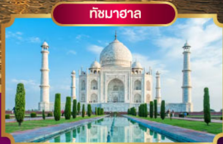
ทัชมาฮาล