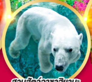
สวนสัตว์อาซาฮิยามะ