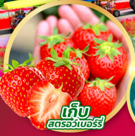
เก็บ สตอร์วเบอร์รี่