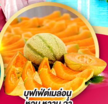
บุฟเฟ่ต์เมล่อน หอมหวาน ฉ่ำ