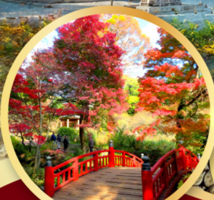
สวนดอกบ๊วยอาตามิ