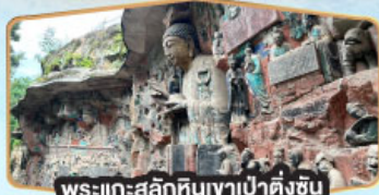
พระแกะสลักหินเขาเป่าตั้งชัน