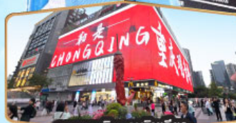
ถนนคนเดินทงยวนเฉียว