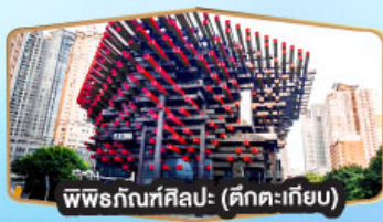
พิพิธภัณฑ์ศิลปะ (ศิลปะเก๋)