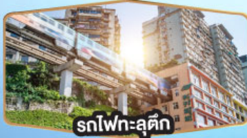
รถไฟฟ้าสุดคึก