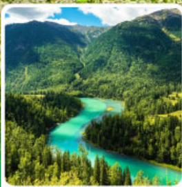
ทะเลสาบคานาสือ