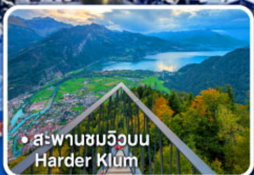
• สะพานชมวิวยิบ Harder Klum