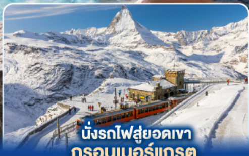
นั่งรถไฟสู่ยอดเขา กรอนเนอร์เกรต