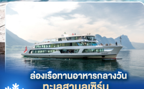
ล่องเรือทานอาหารกลางวัน ทะเลสาบลูซิิร์น