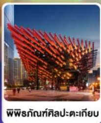
พิพิธภัณฑ์ศิลปะตะเกียบ