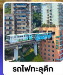
รถไฟฟ้าชตุ๊ตัก