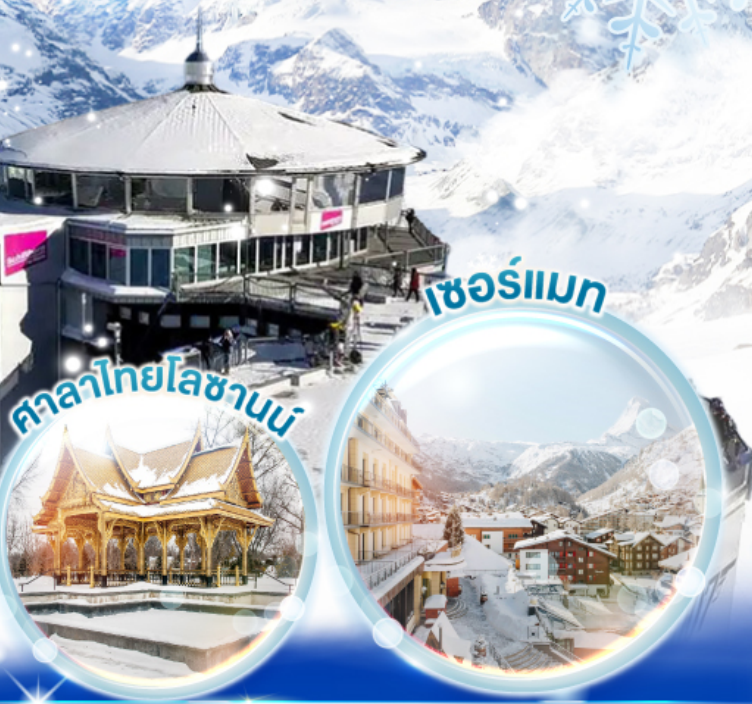
ศาลาไทยโลซานน์