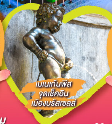
เมเนกันพิส จุดเช็คอิน เมืองบริสเซลส์