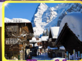
หมู่บ้านมูร์เร็น