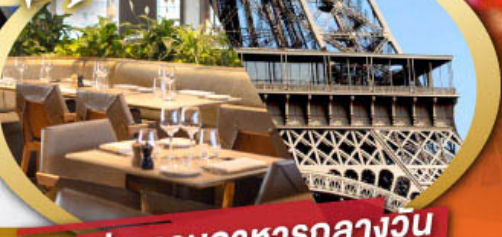
รับประทานอาหารกลางวัน บนหอคอยเฟล