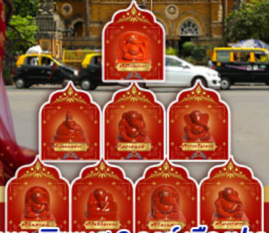
พระพิฆเนศ 8 องค์ เมืองปูณ