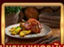
Ribs of Vienna, ปลาเทราสย่าง, จาหุเยอร์มิน

ตะลุยพิชิตยอดเขาทุกสปีซ "Top of Germany" เยือนเมืองมิวนิก จัดดูสมาเรียมพลาทซ์ สัมผัสเมืองมรดกโลก เซสท์ ครุมลอฟ เยี่ยมชมปราสาทปราก ย้อนรอยอดีตซาลซ์บูร์ก สวนมิราเบล บ้านเกิดของโมซาร์ท ปราสาทบราติสลาวา มหาวิทยาลัยเซนต์มาร์ติน สุดโรแมนติกส่องเรือชมความงามแม่น้ำดานูบ จัดดูสวีร์บรูซ พระราชวังฮอฟบวร์ก ขึ้นดากับความน่าหลงใหลของ หมู่บ้านริบทะเลสาบฮัลล์สตัดท์ พระราชวังเฮินบรุนน์ ปิดท้ายช้อปปิ้งจุใจ