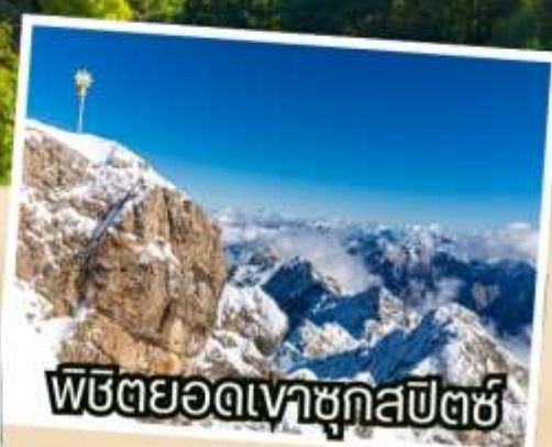
พีชตยอดเทาชุกสปีตซ์