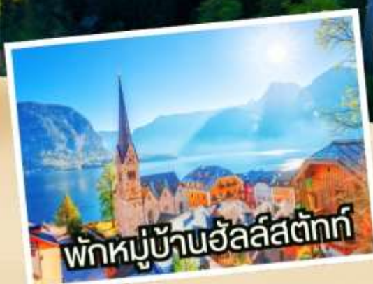
พักผ่อนบ้านอัลส์ตัทท์