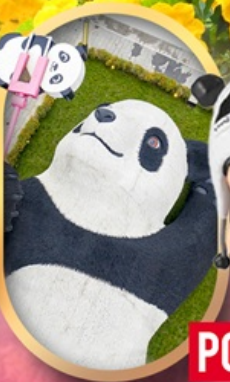
หมีแพนด้าเซลฟี