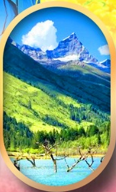
อุทยานสี่ตุ๋น