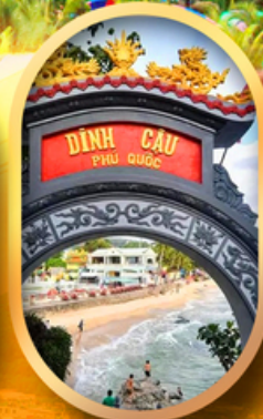
ศาลเจ้าดิงเกา