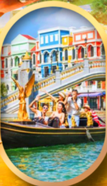
เอนิเมะแห่งเวียดนาม