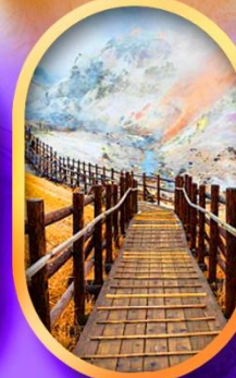
หุบเขานรกจิงคุดานิ