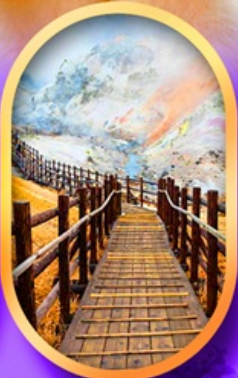
จิกุคคาบิ