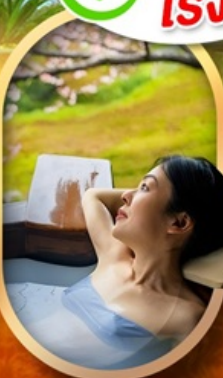
แช่ออนเซ็นญี่ปุ่น