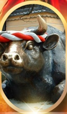
ศาลเจ้าดาไซฟู