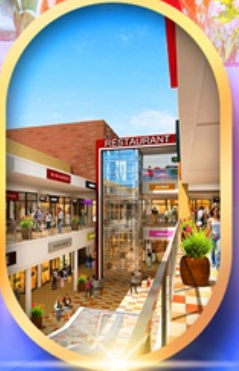
มิตซุชิเอะไกลิท