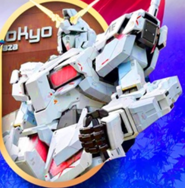
ห้างไอโดะกันดั้ม