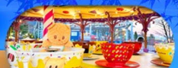
Fuji q Highland x Butterbear เดินทาง พ.ศ. 69 เป็นต้นไป