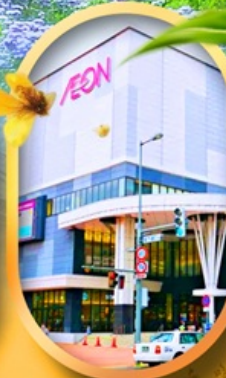
อ็อนมอลล์