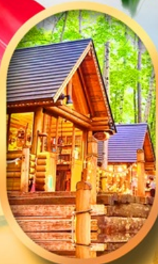
นิงเกิ้ลเกออส