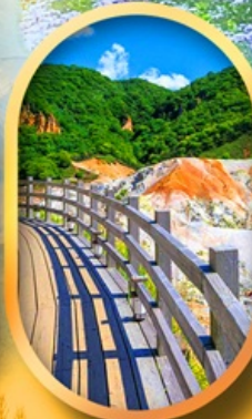
โนโบริเบ็ทสึ