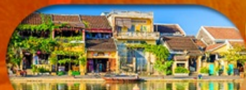
HoiAn Ancient Town ย่านเมืองเก่าฮอยอัน

เวียดนามกลาง ดานัง ฮอยอัน เที่ยวบานาฮิลล์