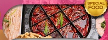
อาหารมือพิเศษ สุกที่มาล่าต้นตำหรับ