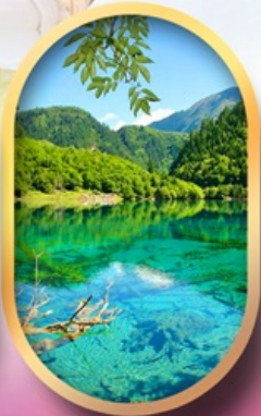
จิ่วจ้ายโกว