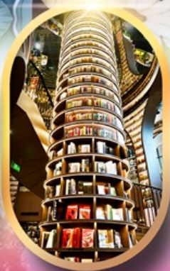
หอหนังสือจงซูเก้อ