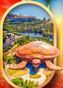
พิพิธภัณฑ์สัตว์น้ำ