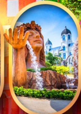
น้ำตกเทพพิหลิง