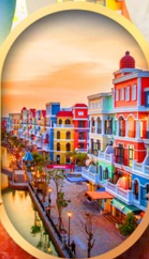
เวนิสแห่งเวียดนาม