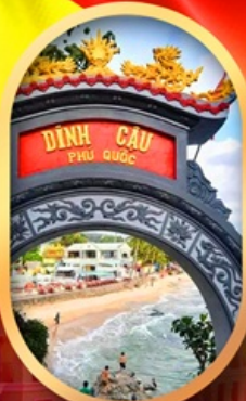
ศาลเจ้าติงเกา