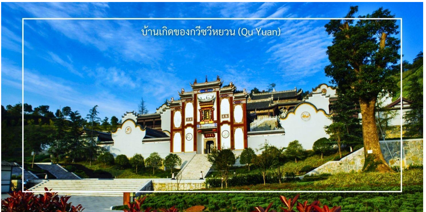
บ้านเกิดของกวีชวีหยวน (Qu Yuan)

นำท่านเดินทางสู่ บ้านเกิดของกวีชวีหยวน (Qu Yuan) สถานที่เกิดของบุคคลสำคัญทางประวัติศาสตร์และวรรณกรรมของประเทศจีน ผู้ได้รับการยกย่องว่าเป็นกวีผู้ยิ่งใหญ่แห่งยุครั้วจ้านกั๋ว และเป็นสัญลักษณ์แห่งความซื่อสัตย์และความจงรักภักดี บ้านเกิดของชวีหยวนตั้งอยู่ริมแม่น้ำแยงซีเกียง เป็นสถานที่ที่สะท้อนเรื่องราวชีวิต แนวคิด และผลงานทางวรรณกรรมอันทรงคุณค่า ซึ่งมีอิทธิพลต่อวัฒนธรรมจีนสืบต่อมาจนถึงปัจจุบัน (รวมรถแบตเตอรี่)