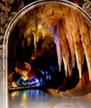
ดำโพรมิริอัส BOAT RIDE

เดินทางช่วงปีใหม่ 27 ธ.ค. - 3 ม.ค. 70 ราคาเพียง 75,989 บาท / ท่าน