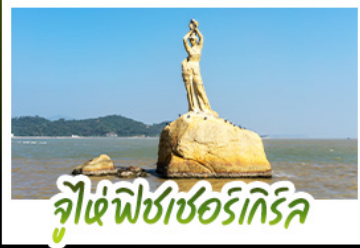
जूड़े फिशर्री किरल