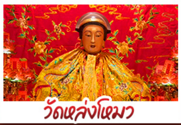
วัดเล่งโฉม