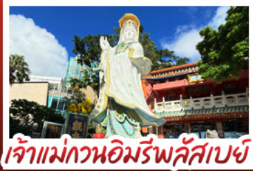
เจ้าแม่กวนอิมรัฟัสเบย์