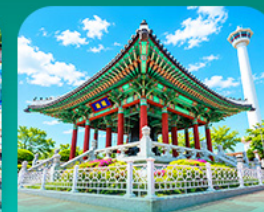
สวนแจงดุซาน