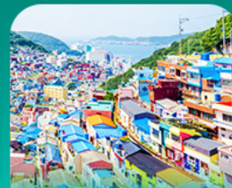
หมู่บ้านแดมซอน