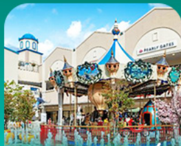
ลือตเต้ เอ้าท์เล็ต