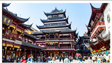
ตลาดร้อยปีเจียงหนิงเมี่ย