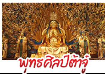
พุทธศิลป์ต้าจู้