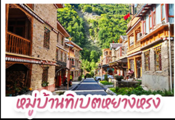
เด็มนบ้านทิบตหยางตรง

ตะลุยเจียงตุ๋น คูหิมะต้ากู่ปิงชวณ ชวนเซ็คอินแพนด้ายักษ์ พักใจที่หยดน้ำด้าสิฟ้า! แวะชิลเมืองโบราณลั่วไต้ สัมผัสมนต์เสน่ห์ หมู่บ้านทิบตหยางหงชวณต่อ สัมผัสความหนาวเย็นที่ อุกยานสวรรค์ธารน้ำแข็งต้ากู่ปิงชวณ แหล่งรวมวิวหลักล้าน ตื่นตากับแสงสียามค่ำคีน หยดน้ำด้าสิฟ้า ณ สะพานหนานเฉียว เมืองคูเจียงเยียน ก่อนปิดท้ายด้วยการช้อปปิ้งจุใจ ถนนชุนซี้-ไท่กู่หลี่ และเซะภาพกับ แพนด้าเซลฟี่ สุดคิวท์