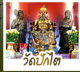
วัดป้กโถ้