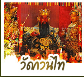
วัดกวนน้้ถ