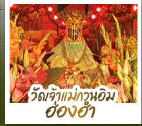
วัดเจ้าแม่กวนอิมอ้งอ้า