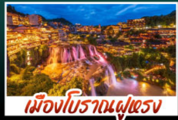
เมืองโบราณฝูเฉิง