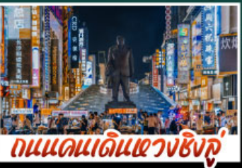
ถนนแดนแดนเซี่ยงชู่