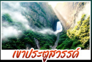
เขาประตูสวรรค์