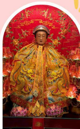
วัดหลงโหมว

ความสำเร็จ ความมั่งคั่ง เงินทองไหลมาเทมา