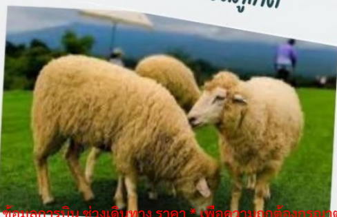
ฟาร์มแกะ