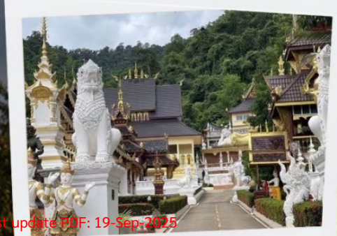
วัดไชยสถาน