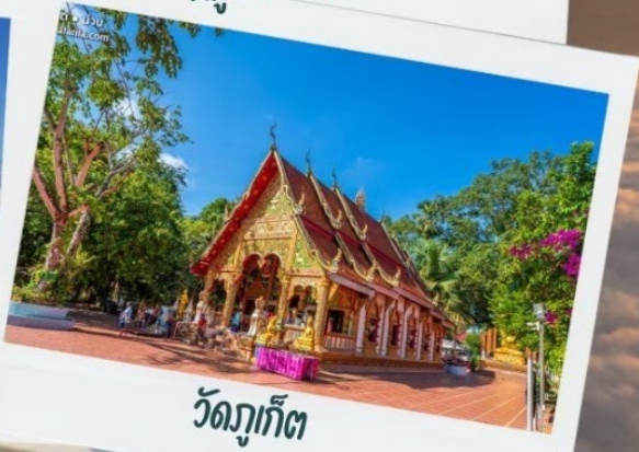
วัดภูเก็ต