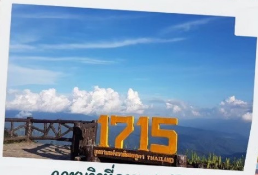
จุดชมวิวที่ความสูง 1715