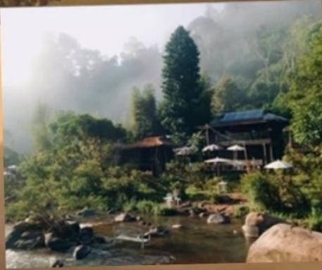
แม่บ้าน ส=สวน