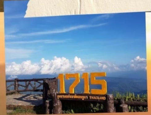
จุดชมวิว 1715