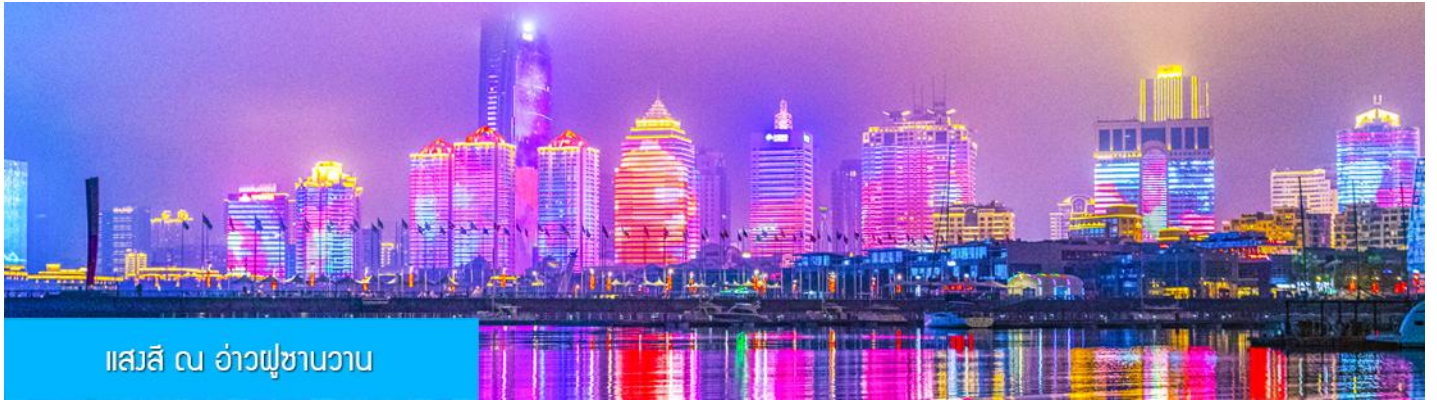
แสงสี ณ อ่าวฝูซานวาน