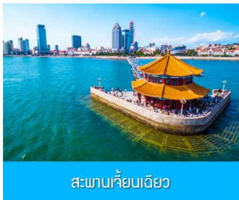
สะพานเคียนเฉียว

เช้า รับประทานอาหารเช้า ณ ห้องอาหารของโรงแรม (1)