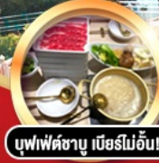
บุฟเฟ่ต์ชาบู เสิร์ฟไม่อั้น!!