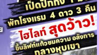
พักรูม 4 ดาว 3 คืน ไฮไลท์ สุดว้าว! ขึ้นลิฟต์แก้วชมความอลังการ กลางหุบเขา