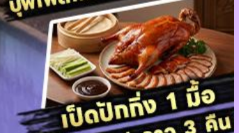
เปิดปากถึง 1 มื้อ