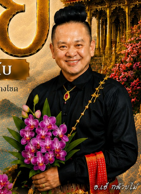
อ.เอ๋ ท้าววยไม้

เสริมโชคลาภ การงาน การค้า เปิดทางรวย เงินทองไหลมา