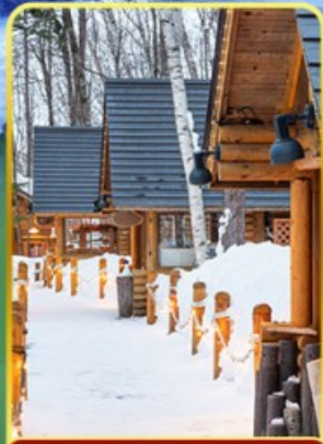
นิกิเกิลทอรา