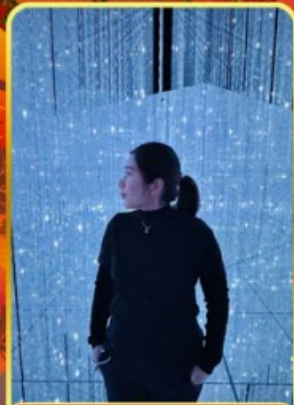
ทีมแอบโตเกียว

🌀 ออนเซ็น 2 คั้น 🧳 นน.กระเป๋า 23 กก.X2 🌞 8Days 5Night