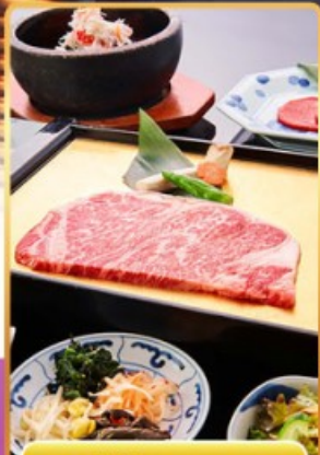
บุฟเฟ่ต์ ROKKASEN