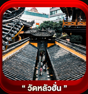
“ วัดหลิวฮั่น ”