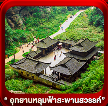
“ อุทยานหลุมฟ้าสะพานสวรรค์ ”