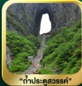
"กำประตูลิ่ว"