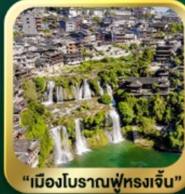
"เมืองโบราณฟูหลงเจิน"